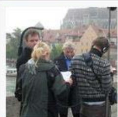
Bayerisches Jahrtausend Dreh mit Udo Wachtveitl 11 Fotos