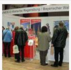
Pinnwand-Fotos 13 Fotos