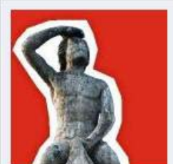
Profilbilder 4 Fotos