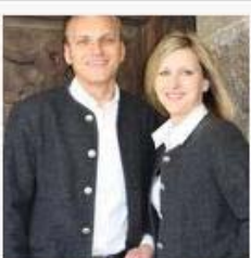
Trachtenjanker und Regensburg-Knöpfe 4 Fotos