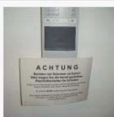
April, April 12 Fotos