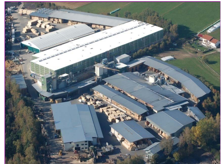
Stammproduktionswerk + Logistikzentrum in Regen / Metten

2 Starkholzsägewerke • 3 Fensterkanten-/Komponentenwerke 1 Hobelwerk • 1 Holzverarbeitungsbetrieb mit modernem Maschinenpark für Massivholzbearbeitung und Oberflächentechnik 1 Pellet- und Brikettwerk • 1 Holzheimwerkermarkt