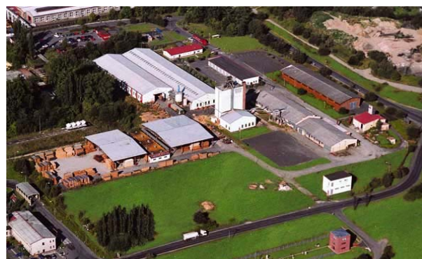
Fensterkantenwerk in Cheb