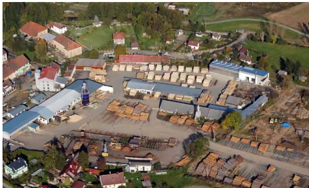
Sägewerk in Klatovy / Luby