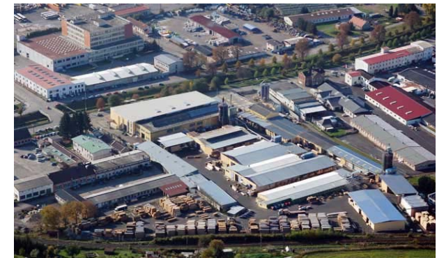
Leimholzkomponentenwerk in Klatovy