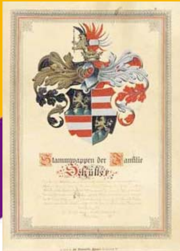
Das Familienwappen der Schillers aus dem 16. Jahrhundert